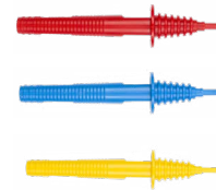
Sonda ostrzowa 1 kV (gniazdo ba- nanowe) czerwona / niebieska / żółta