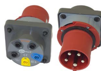
Adapter gniazd trójfazowych 63 A