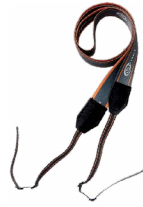
Szelki do mier- nika (typ M1)