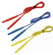
Przewód 1,2 m (wtyki bananowe) czerwony / nie- bieski / żółty