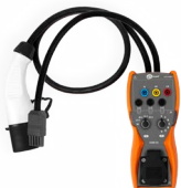
Adapter EVSE-01 do testów stacji ładowania pojazdów elektrycznych