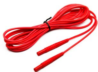
Przewód do pomiaru pętli zwarcia (wtyki bananowe) 5 m / 10 m / 20 m