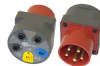
Adapter gniazd trójfazowych 16 A / 32 A