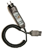
Adapter WS-03 wyzwalający pomiar (wtyk UNI-Schuko)