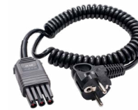
Adapter WS-04 (wtyk kątowy UNI-Schuko)