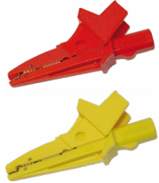
Krokodylek 1 kV 20 A czerwony / żółty